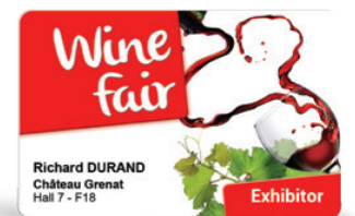
Einladungen zu Ihren Events